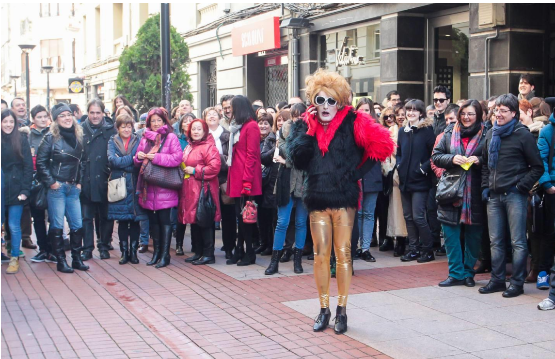
Maestro de Ceremonias

Advierte: “esto es muy cabaretero y muy friki. La animación en la sala es pura diversión y puede pasar de todo; la gente baila, canta, se besa, grita... hace de todo». Recomienda, además, que el público acuda disfrazado o con ligeros, que es como mejor se lo va a pasar.